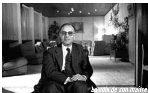
La voix de son maître

Autour de la série télé Les vivants et les morts . Une réflexion sur sa démarche d'écriture, avec projections d'extraits de la série, animée par Francisco Ferreira, qui enseigne la littérature et le cinéma à l'Université de Poitiers.