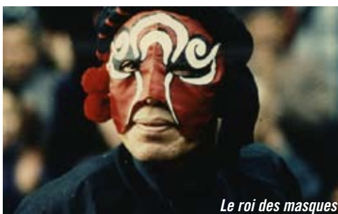
Le roi des masques

14H30 Le Roi des masques DE WU TIAN-MING