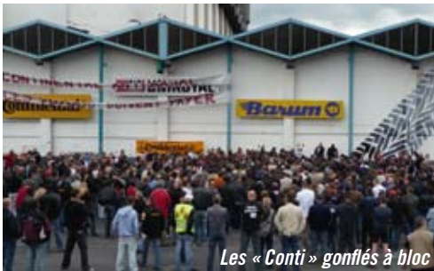
Les « Conti » gonflés à bloc