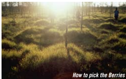
How to pick the Berries

18H30 Deux festoches, un cinoche ! Une sélection de cinq courts-métrages d'écoles interrogeant le monde du travail concoctée par les équipes des Rencontres Henri Langlois et de Filmer le Travail et avec la complicité du TAP Cinéma. APÉRO OFFERT À L'ISSUE DE LA SÉANCE