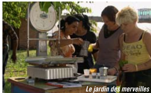
Le jardin des merveilles