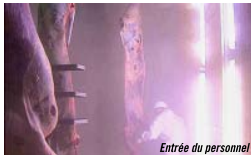
Entrée du personnel

DE AMANDINE FAYNOT DOCUMENTAIRE · FRANCE · 23 MIN · 2010 · AUTO-PRODUCTION À Istanbul, le sacrifice du mouton, rituel encore récemment orchestré par le père de famille, est désormais accueilli dans une enceinte publique municipale. Des sacrificateurs professionnels y mettent en scène une mise à mort en série, codifiée, parfaitement réalisée.