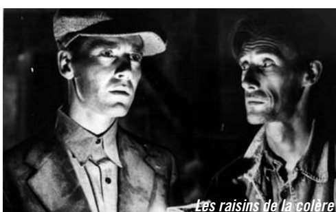
Les raisins de la colère

TARIFS 4,5 € / 2,50 € AVEC LE PASS ARTS DU SPECTACLE