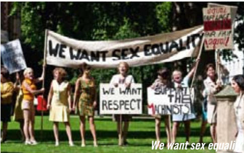
We want sex equality

Une sélection d'archives des actualités locales liées au travail des femmes proposée par l'Ina et présentée par Sylvie Richard (Ina).