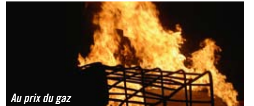
Au prix du gaz