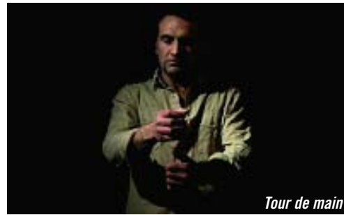
Tour de main

Une île qui n'est guère plus qu'un rocher isolé au large des côtes péruviennes. Sans terre, ni eau, ni végétation, mais peuplée de centaines de milliers d'oiseaux. Des centaines de travailleurs viennent sur ce rocher pour récolter les fientes des volatiles qui serviront d'engrais dans l'agriculture.