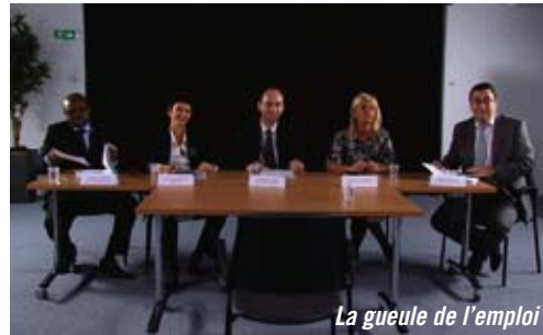
La gueule de l'emploi

DE PALACIO ROJO FICTION · ESPAGNE · 8 MIN · 2011 · LEMENDU FILMS Exercice de style déroutant autour des relations de travail dans le milieu des cadres.